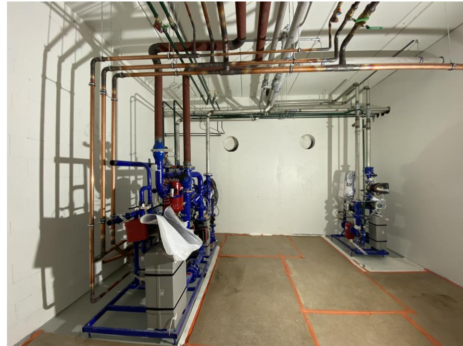
Pojat tekassu vimosen päälle lämmitykset