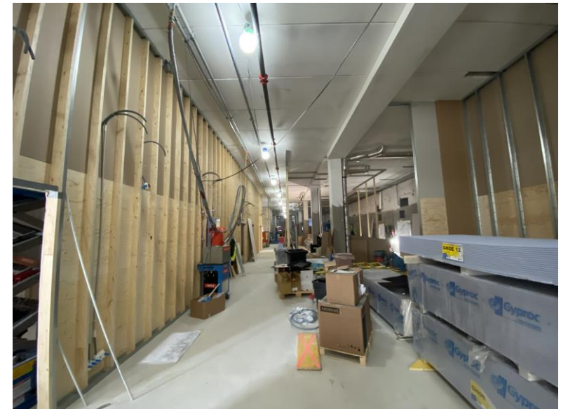
0-kerroksessa väliseinää syntyy ja tilaa on!