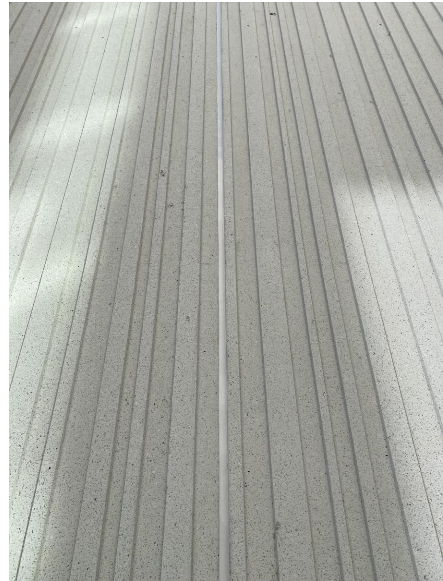
Hirviän sievää saumaa julkisivussa