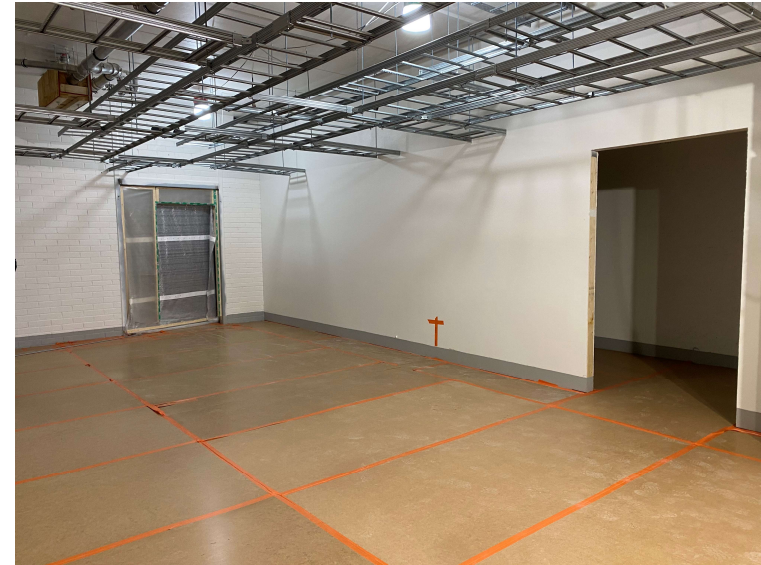
Sähköpääkeskustilojen lattiat suojattu ja pinnoitettu