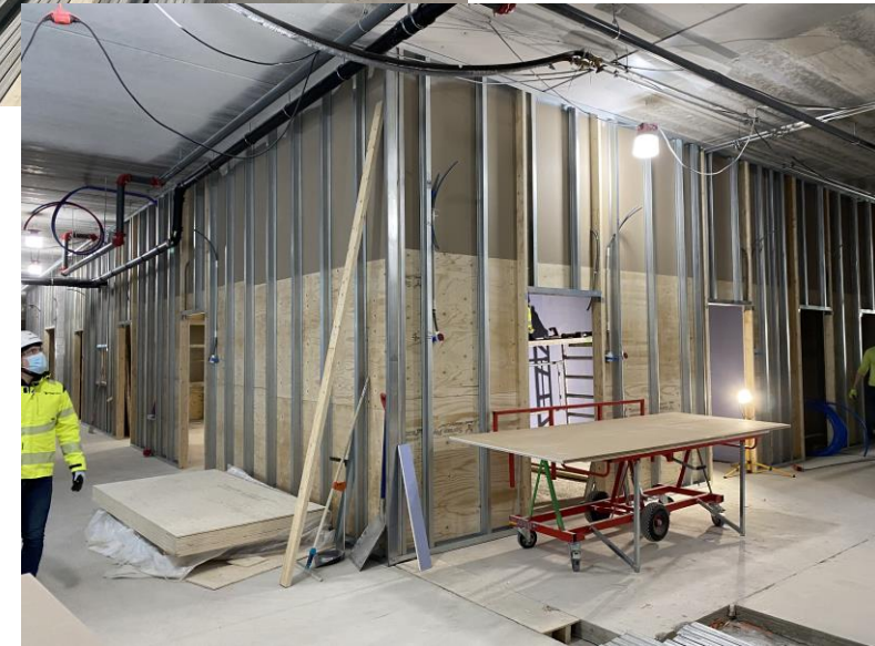
1-kerroksessa väliseinät etenevät ja työmaan ylin johto hykertelelee maskin suojassa