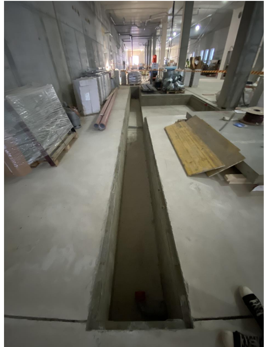
Kuvassa 0-kerroksen lattioiden tekniikkakanaalin mallia ja komiat työkengät