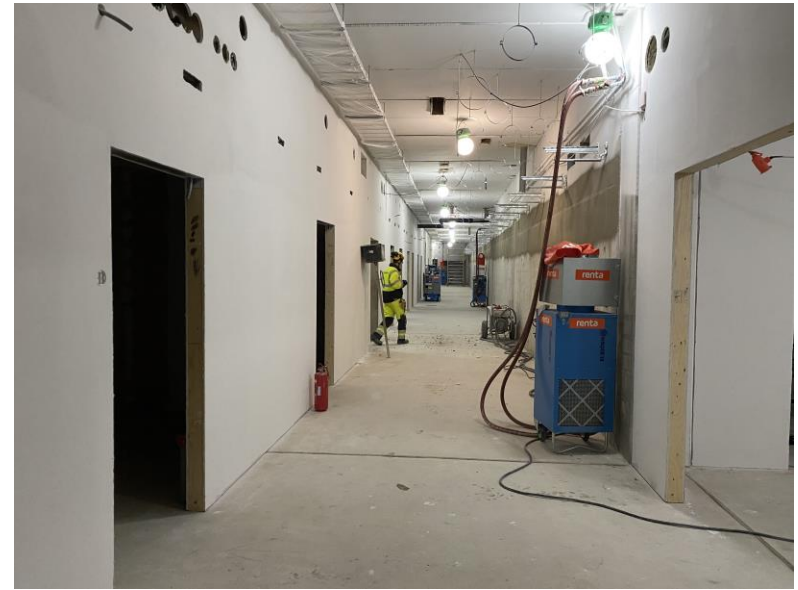
T-kerroksessa kuorruteltiin seiniä