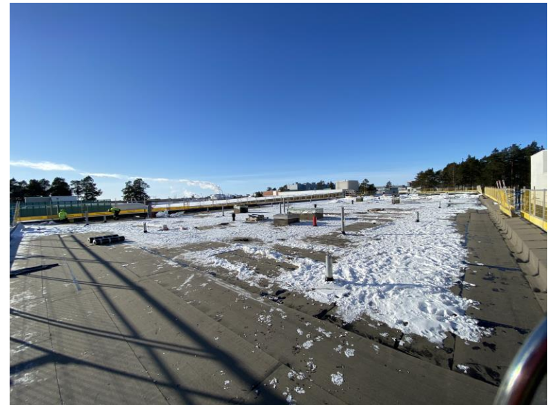
Vesikattotyöt jäävät nyt tauolle kevääseen saakka