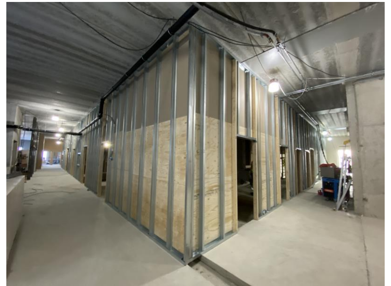
1-kerroksessa kipsilevyväliseinät hyvässä vauhdissa