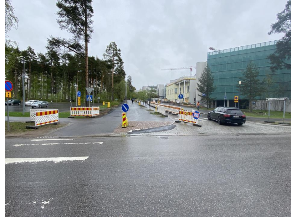
Kaupunginsairaalan kulkutien uudet, ehkä jopa entistä paremmat liikennejärjestelyt