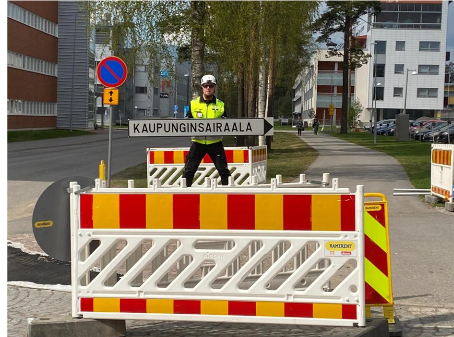
Työmaaorganisaation roolit alkavat selviämään, toisin kuin itse henkilöt...