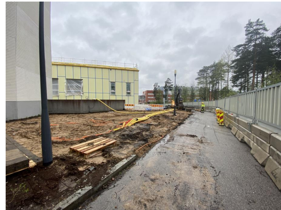
Kaivutyö voidaan aloittaa