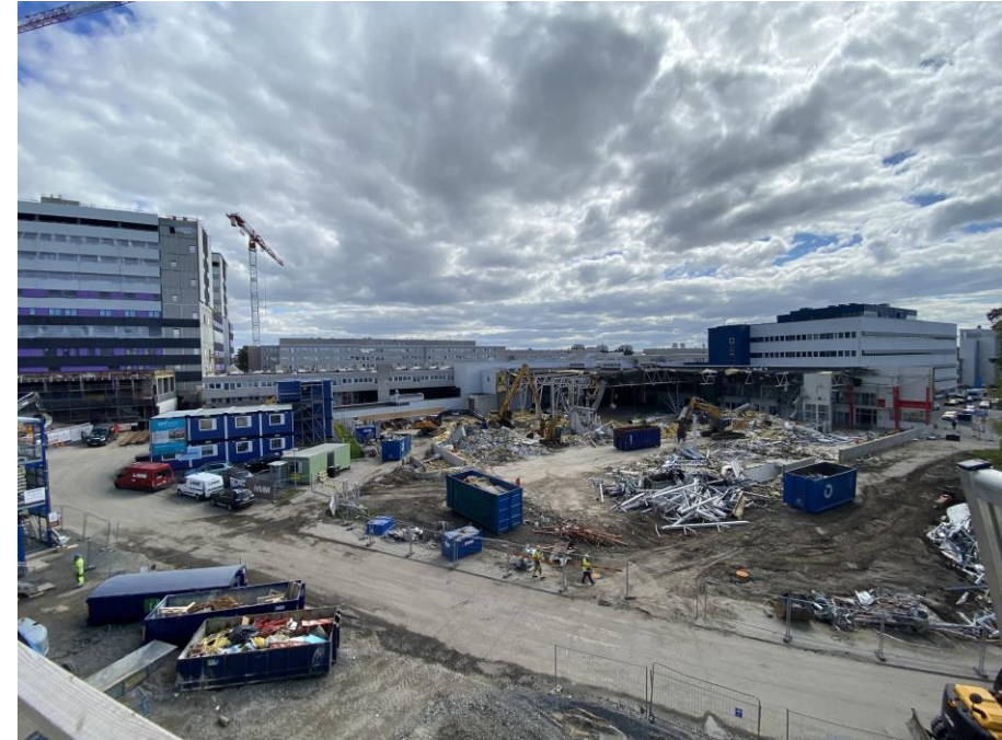
Rajanaapurillakin homma on päivä päivältä valmiimpi