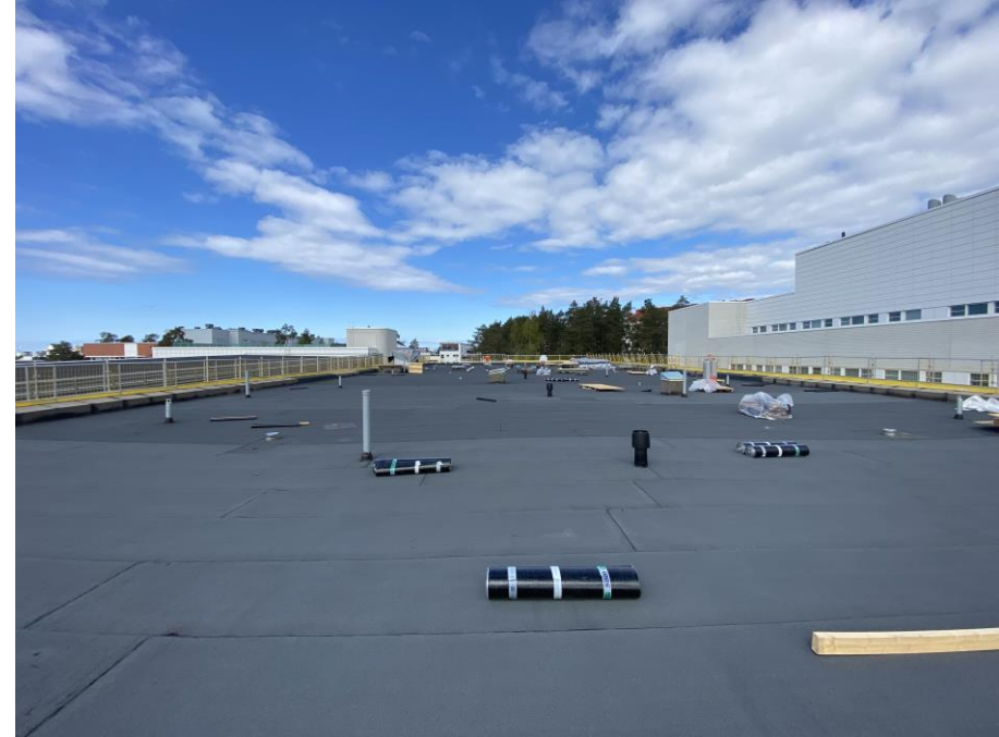
Vesikatolla pintaa syntyy