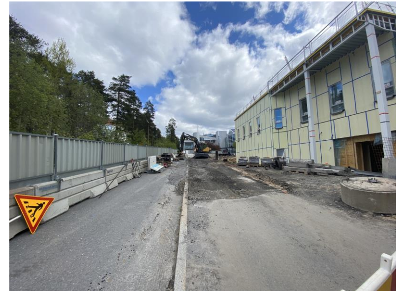
Vanha tukimuri lähti ja uutta odotellaan valmistuvaksi