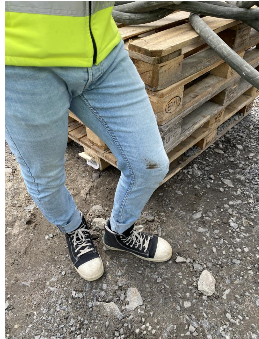
Työnjohdon sitoutuminen on käsittämättömällä tasolla!!! Vastuullakin on haalarit yltäpäältä savessa lähes päivittäin