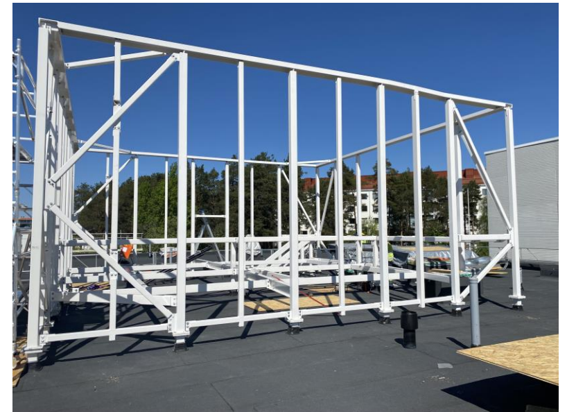
Vesikatolla alkaa pinnat olla kuosissa ja laitetelineitä suojaseinieneen asennetaan