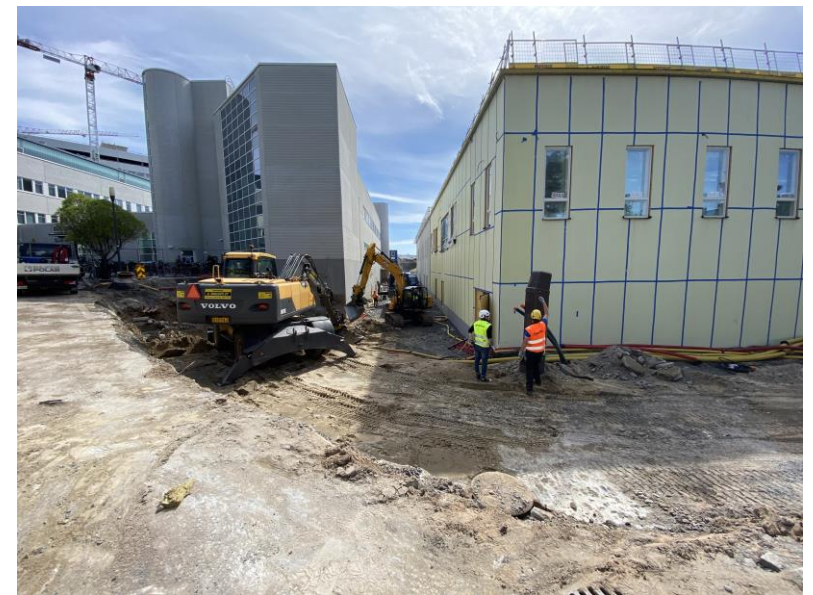
Ensi viikolla päästään käynnistelemaan anturatiitä tukimuurin osalta