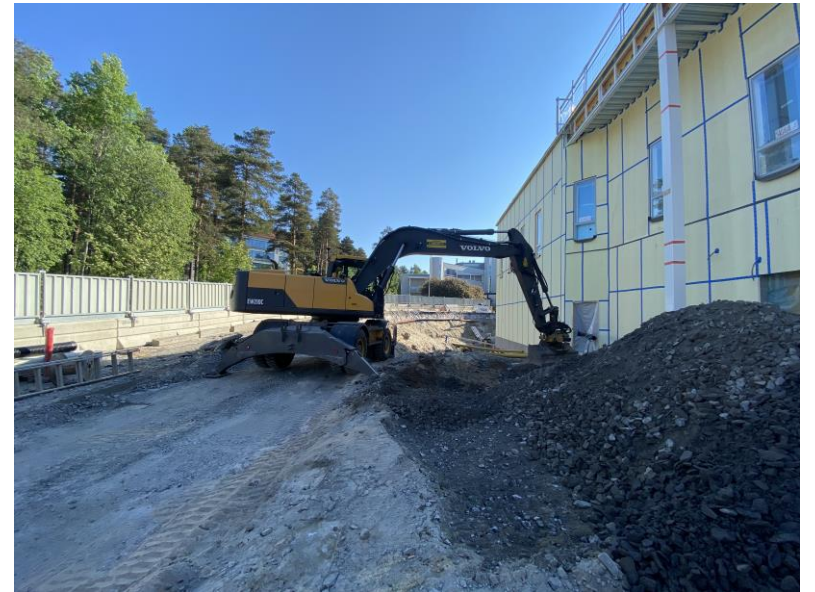
Tukimuriin liittyvät työt etenevät