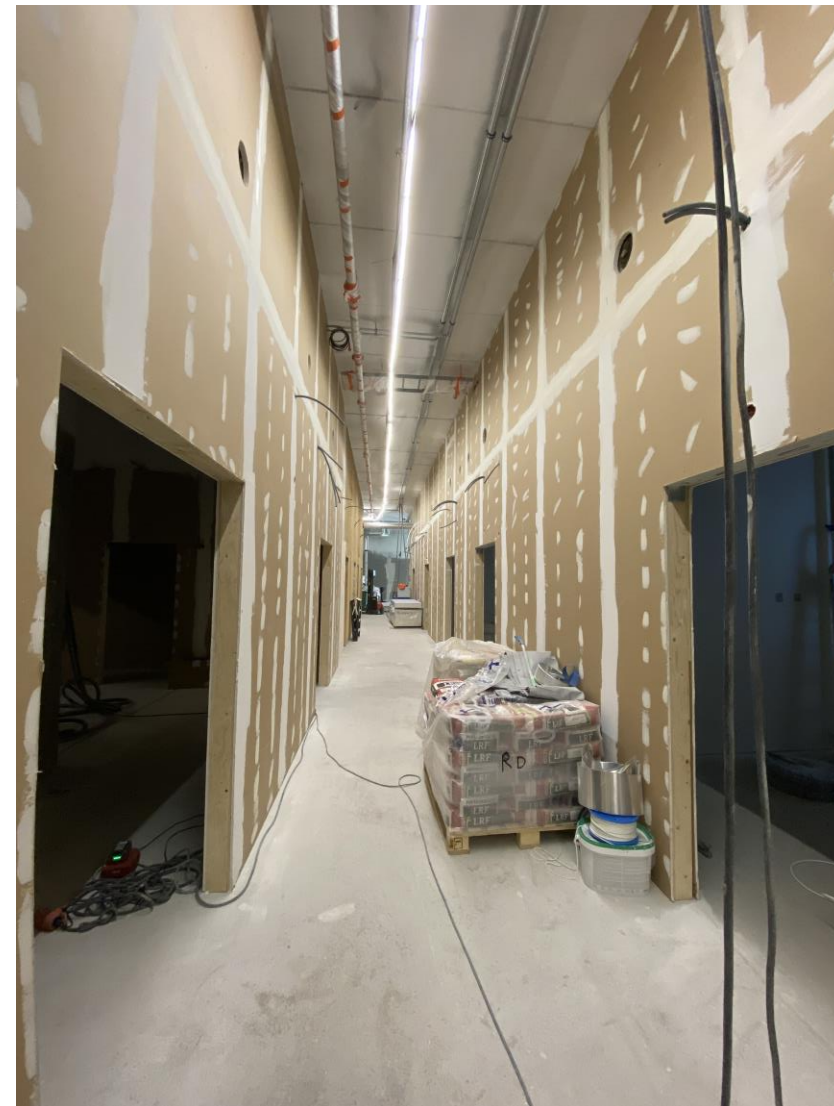
0-kerroksessa on painettu pintapuolen duunii