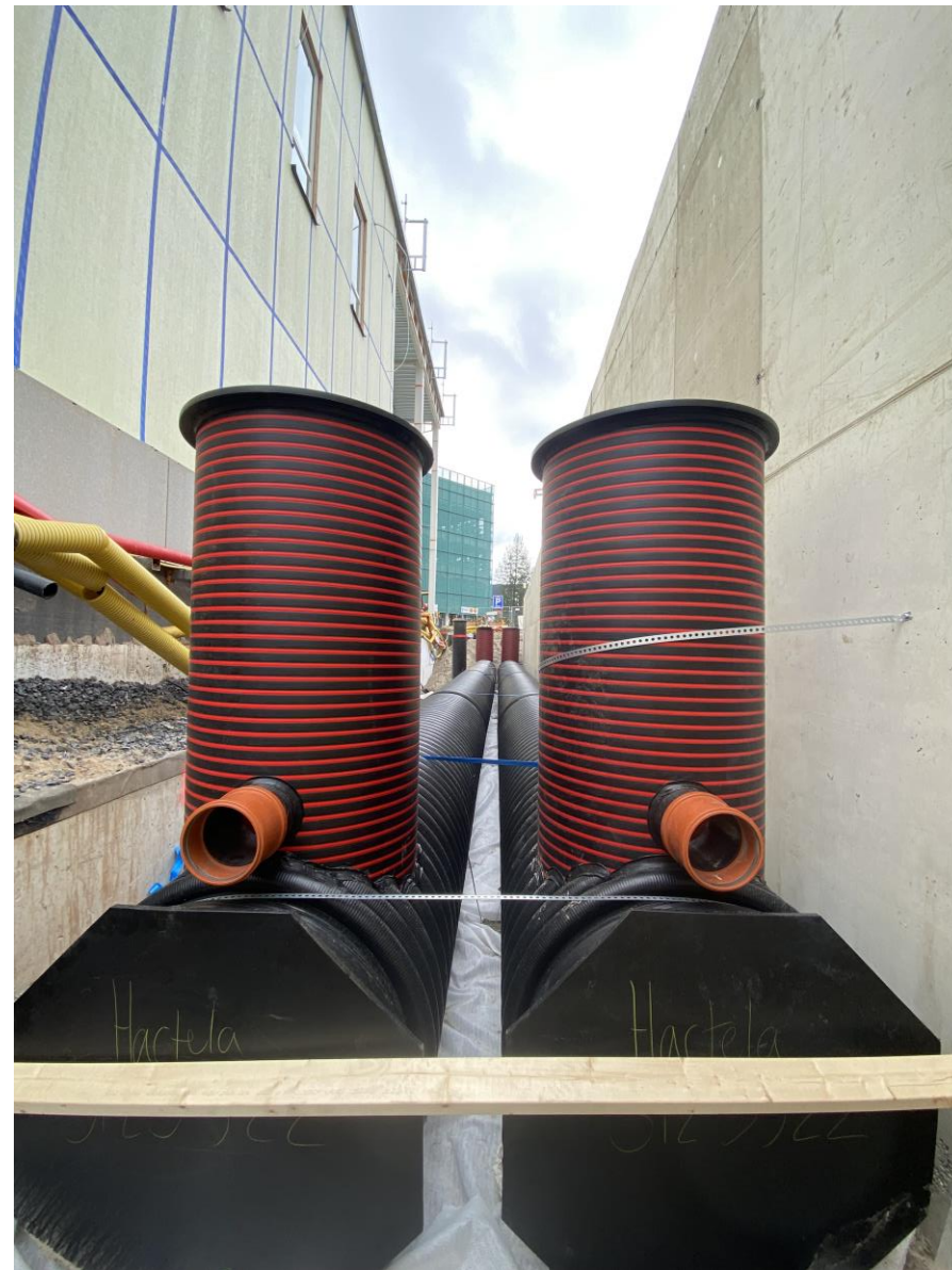
Kaupunginsairaalan sisäänajotien puoleiseen päätyn asennettiin sadevesijärjestelmän tarpeeseen viivästyssäiliöt