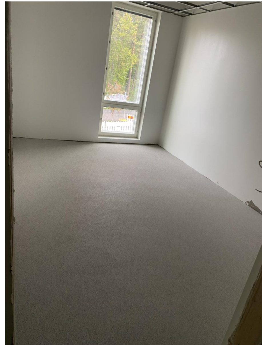
Mallia 1-kerroksen tilojen lattiapinnnoitteesta