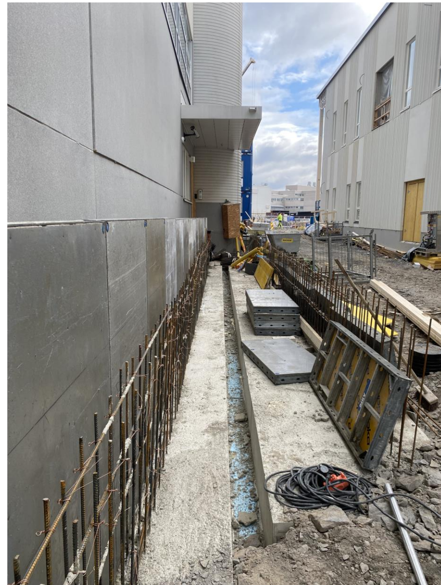
Kaupunginsairaalan sisäänkäyntiä varten tehdään luiskia ja portaita