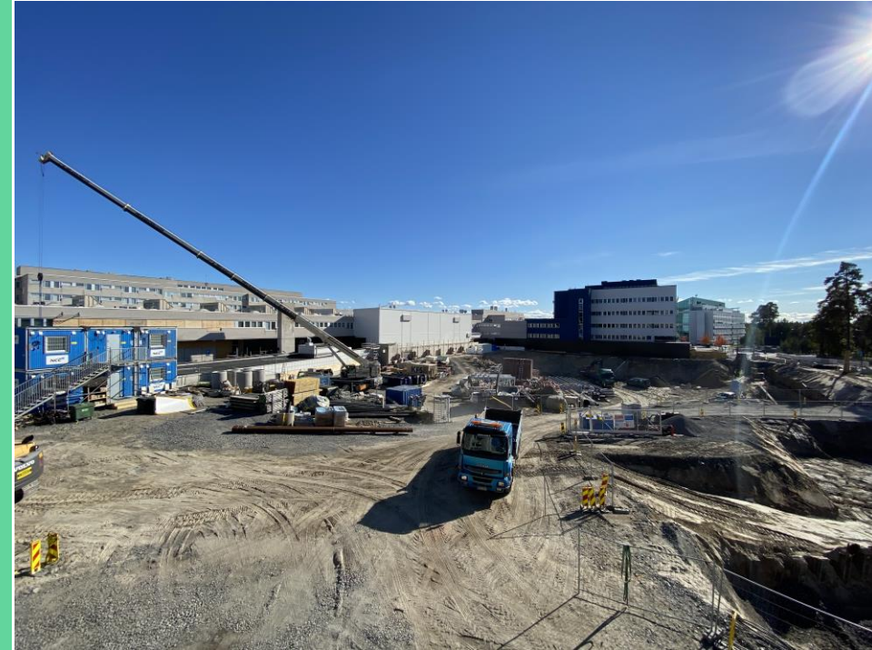
Naapurissa on iso monttu