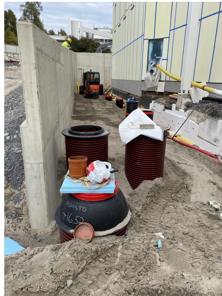
Tukimuriin liittyvät työt etenevät