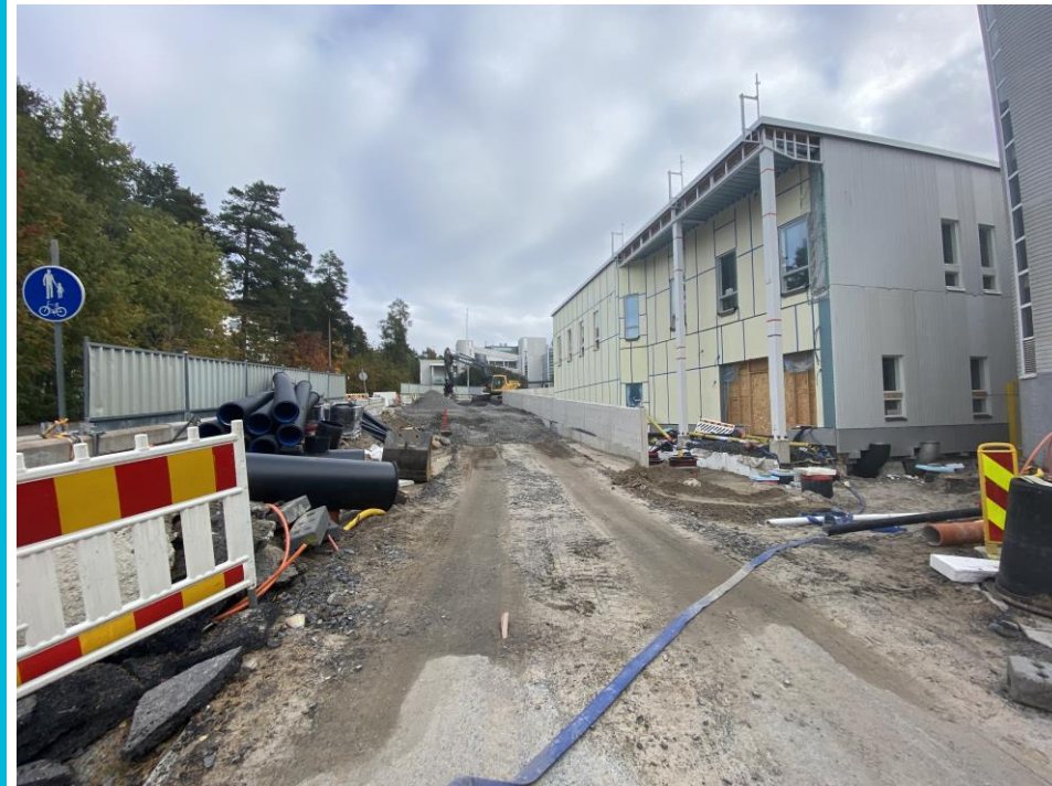
Tukimuurin ympäryksen täytöt vähenevät vääjäämättä