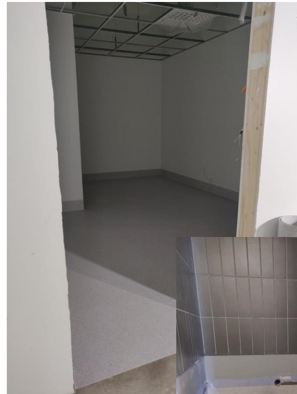
Meillä pyssyy pitämättäki....