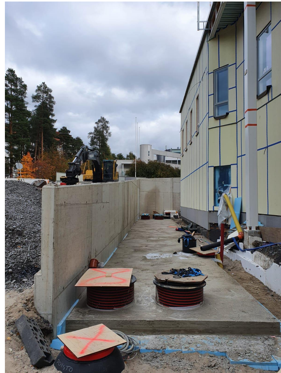
Valuhommat taas yhtä laattaa vähempänä