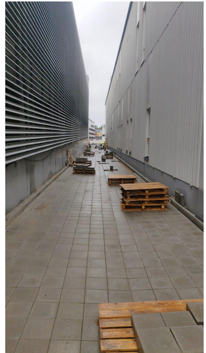
Pihojen pintahommat etenevät