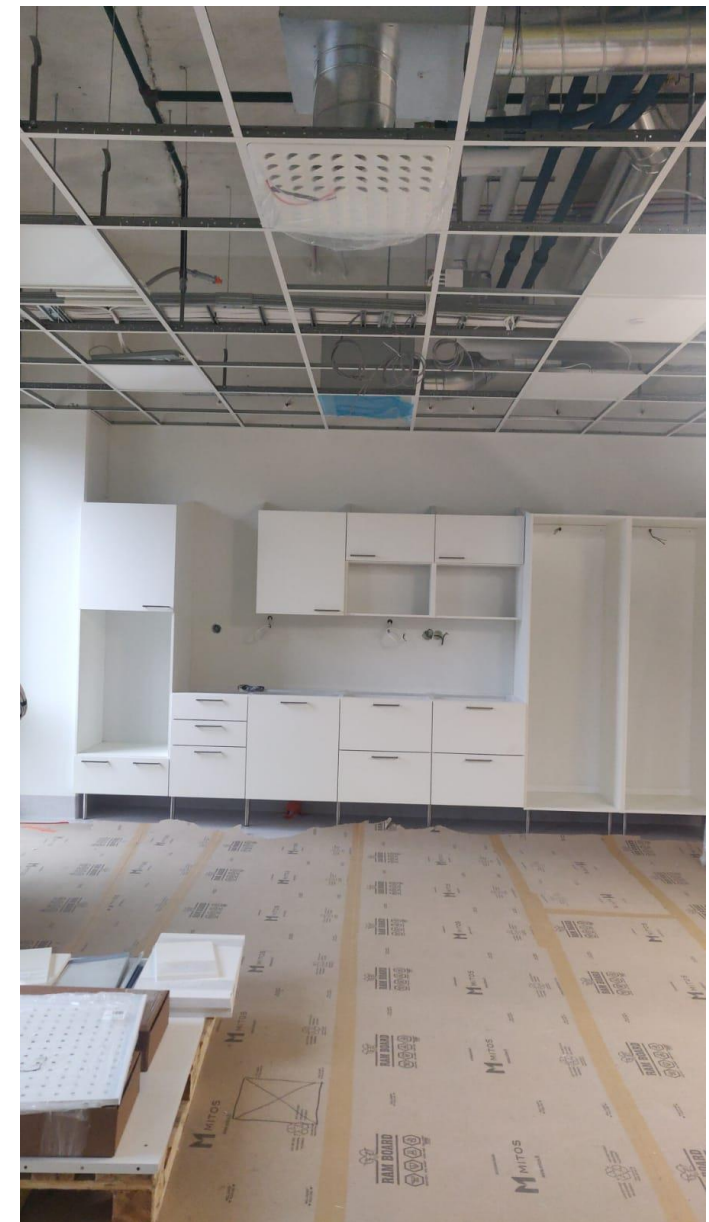
Kalusteasennukset käynnissä 1-kerroksessa