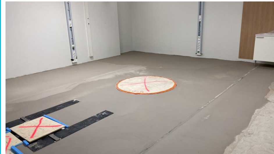
Baseframen ympärykset siloteltu