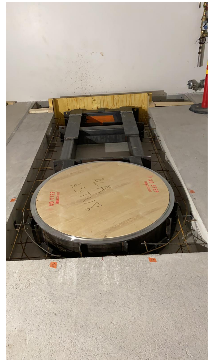
In Finland we call this thing Peisfreimi